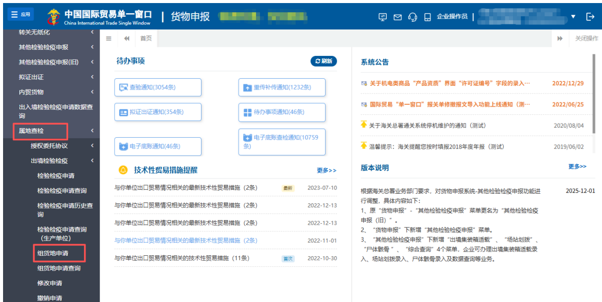
图 组货地申请入口