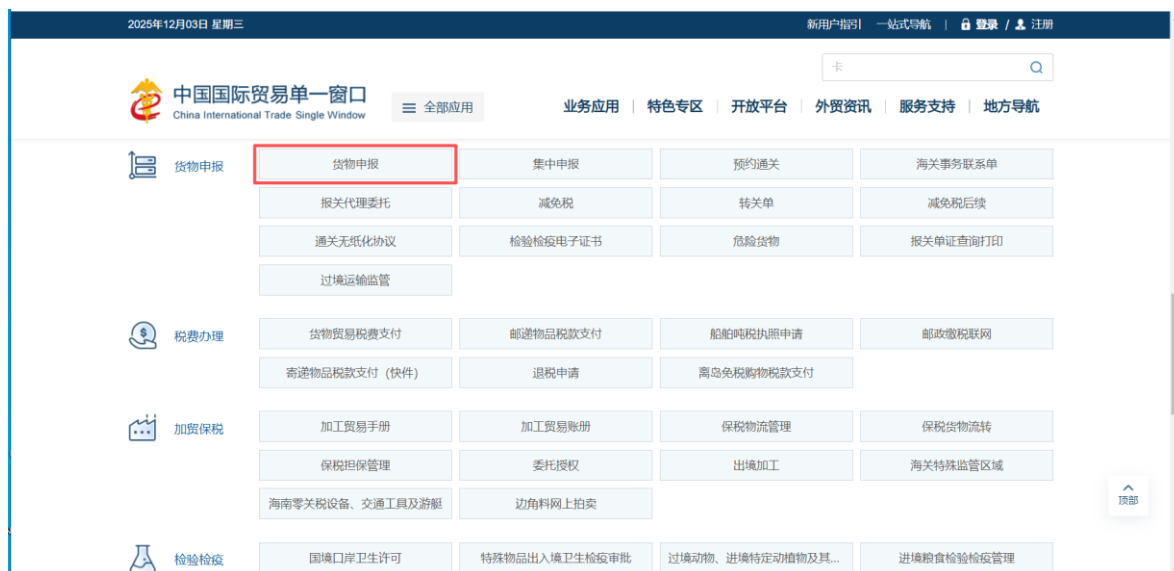
图 货物申报系统入口

打开“单一窗口”门户首页（ https://www.singlewindow.cn ），点击“业务应用”，依次选择“口岸执法申报-货物申报-货物申报”（如图1），在登录页面根据提示使用电子口岸卡介质登录，进入货物申报-属地查检系统-组货地申请界面。