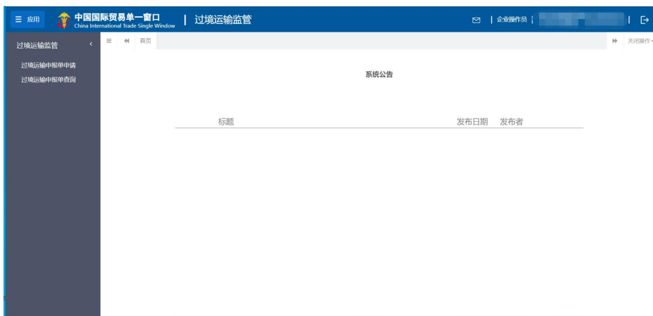
图 过境运输监管系统

为了保护您业务信息的安全，在业务数据录入、暂存或申报等过程中，您的卡介质请一直插入在读卡器或电脑中，不可随意插拔。系统将根据卡介质的信息进行用户的身份验证，并对业务数据自动进行电子签名、加密。