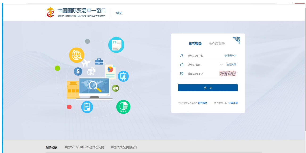
图 “单一窗口” 标准版登录

在图“单一窗口”标准版登录页面中，点击【卡介质】，输入您拥有卡介质的密码，点击登录按钮，即可进入过境运输监管系统（如图过境运输监管系统）。