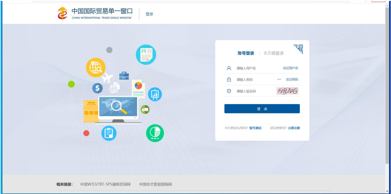
图 “单一窗口” 标准版登录