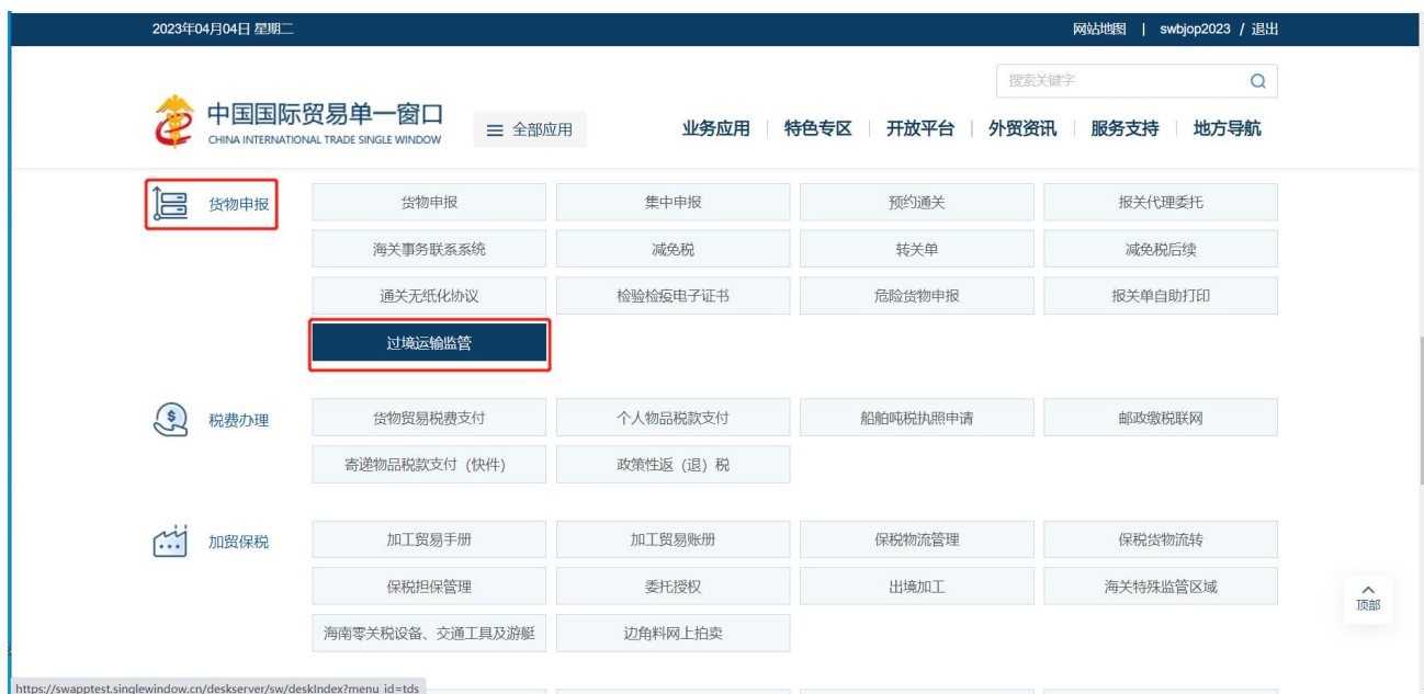
图 口岸执法申报业务应用

在口岸执法申报业务应用界面找到货物申报栏目里的过境运输监管，点击过境运输监管，页面跳转到登陆界面（如图“单一窗口”标准版登录）