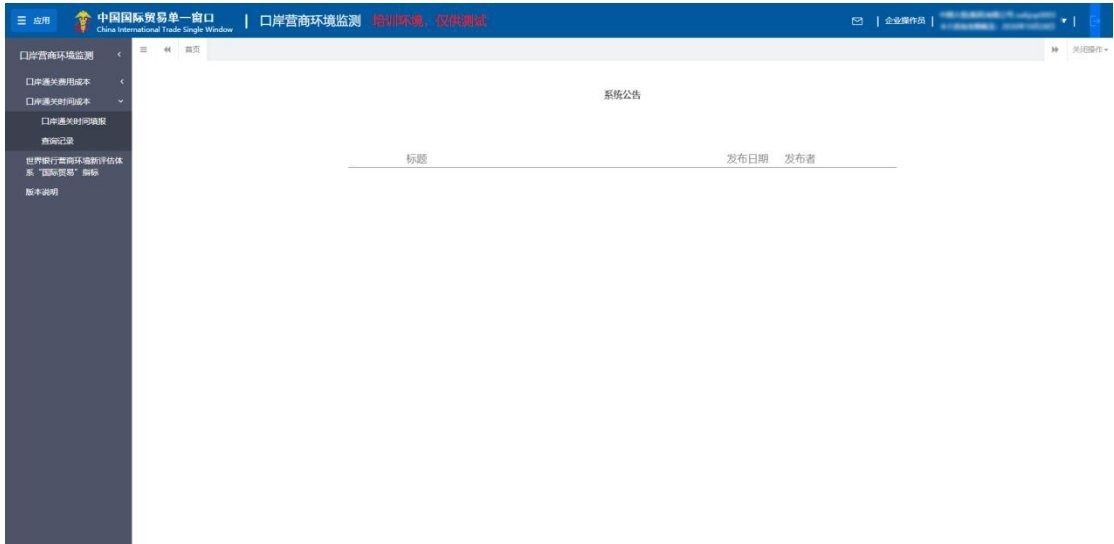
图 口岸通关时间成本