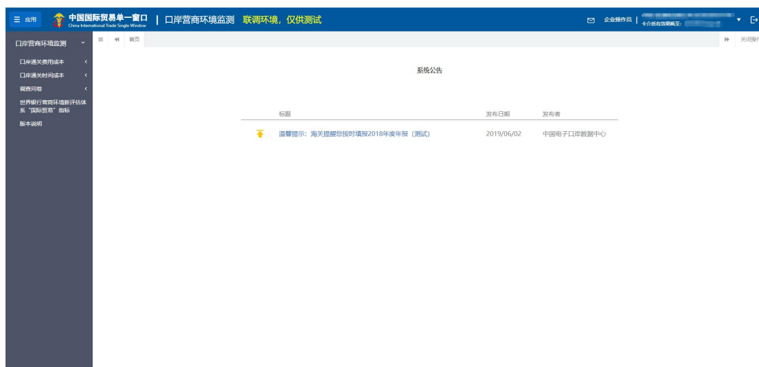
图 口岸成本报送系统主界面