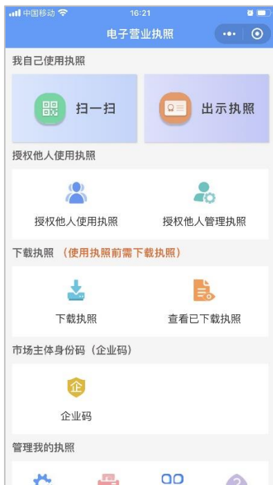
图 电子营业执照小程序